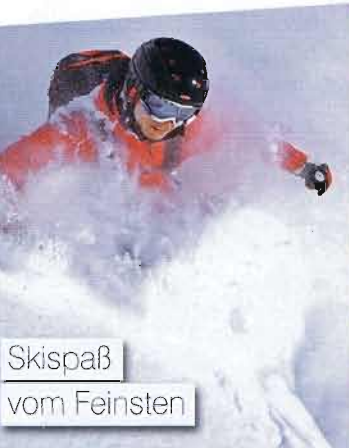
Skispaß vom Feinsten